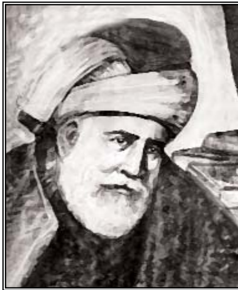
Jalal-u'din Rum (una idea del artista sobre cómo podría haber sido él).

¡Amigo! Siéntate al lado de aquel Que conoce la condición de tu corazón, Y quién puede hacerlo todo; Mientras tanto, descansa bajo la sombra de un árbol cargado con flores frescas y fragantes. No pierdas tiempo en el mercado, yendo de un negocio a otro, como lo hacen los holgazanes. Ve directo a donde aquel que tiene un almacén de miel. ¡Oh alma valerosa!, agárrate de las vestiduras De aquel que conoce bien las regiones espirituales del camino, Quién es tu verdadero amigo en la vida, o en la muerte; En este mundo y en el próximo. - Maulana Rumi