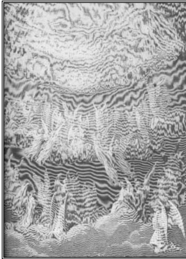
EL CORO CELESTIAL- Grabado de GUSTAVE DORÉ

Mis pinturas fueron expuestas en las Galerías Thompson, en Greenwich Village, junto con dos óleos originales, grandes y poco comunes de Gustave Doré, de quién podría decirse es el más grande ilustrador del siglo XIX. Famoso por sus asombrosos grabados de La Rima del Viejo Marino , La Divina Comedia , de Dante y El Paraíso Perdido , de Milton, Doré no era conocido por sus pinturas al óleo sobre lienzo, las cuales se caracterizaban en realidad por el uso sublime del color, la iluminación, la forma y la profundidad. Durante la recepción que se ofreció esa noche para inaugurar la exposición, cayó sobre la ciudad una terrible tormenta eléctrica. Ningún comprador ni crítico alguno apareció, ¡ni siquiera por el invaluable Doré! La exposición fue un fracaso.