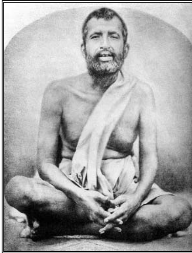
Sri Ramakrishna saliendo del samadhi

Mi búsqueda de la transformación hizo que el alcohol, las drogas y los cigarrillos se desvanecieran como pieles muertas. Sentí que la carne animal era algo indeseable para mi cuerpo. Primero la carne roja, luego el pescado, las aves y aún los huevos fueron descartados y reemplazados por la abundancia del reino vegetal. Aceptando la disciplina de la continencia, con la ayuda del Divino tan constantemente implorado, le di la espalda a mi vida anterior y nunca miré hacia atrás. Gracias a esta nueva forma de vida, la vitalidad en mi cuerpo se renovó, varias enfermedades desaparecieron y con ellas, hasta mi apariencia de anciano demacrado.