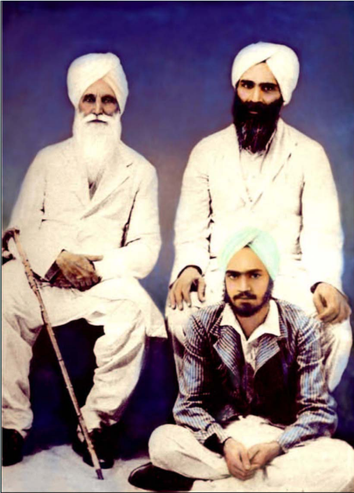
De izquierda a derecha: Hazur Baba Sawan Singh, Sant Kirpal Singh y su hijo Darshan Singh, hacia el año de 1939. Foto en blanco y negro, retocada por el autor.