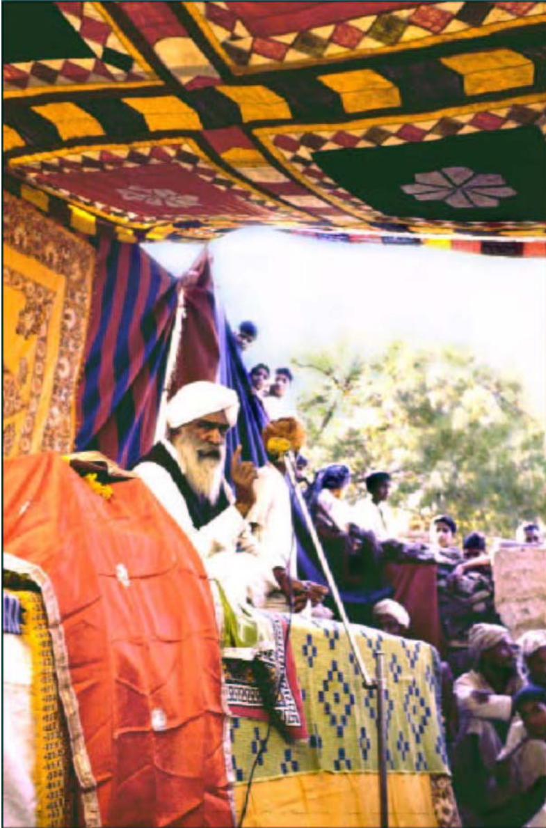
Satsang en la aldea de Dantal, 1967 (AS)

Aturdido, de nuevo le pregunto, “¿La Forma Radiante del Maestro?” (En Occidente, entre el diez y el veinticinco por ciento tiene esta experiencia en el momento de la iniciación).