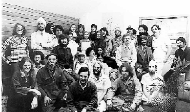
Parte del personal de la fábrica y panadería LifeStream - 1979

Más allá del desarrollo de LifeStream en Canadá y admitiendo que era una empresa mundana, el trabajo del Maestro, espiritual y caritativo, sin ánimo de lucro, también estaba creciendo alrededor del mundo. En Vancouver, grandes cantidades de gente joven, a veces más de 150 personas, asistían a las charlas y meditaciones gratuitas en el YWCA. La comunidad era fuerte pero indisciplinada. Algunos tenían problemas para deshacerse de las drogas. El Maestro había sido claro acerca de responsabilidad para no entrometerme ni juzgar, sino ejercer tanto el desprendimiento como la compasión cuando los hermanos y hermanas resbalaban, se desviaban o me dirigían su negatividad. Era una