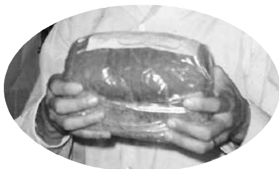
Pan integral orgánico recién salido